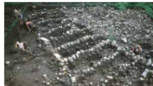
Enterramientos en forma de corredor del sitio arqueológico Severo Ledesma. Caribe Central Colección Museo Nacional de Costa Rica.

Generalmente, estos trípodes se fragmentaban y se depositaban en la parte superior del enterramiento junto con otra cerámica y metates fragmentados, así como con una cantidad importante de hachas y manos para moler. Estas tumbas se colocaban una al lado de la otra, lo cual se llama enterramiento tipo corredor.