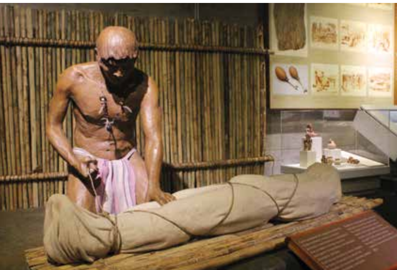
Escena que muestra a un enterrador envolviendo el cuerpo de un fallecido. Recreación. Museo del Oro Precolombino.