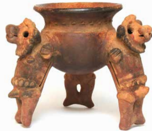
Jarrón trípode Ticabán con figura humana con máscara de animal. Caribe Central Colección Museos del Banco Central.