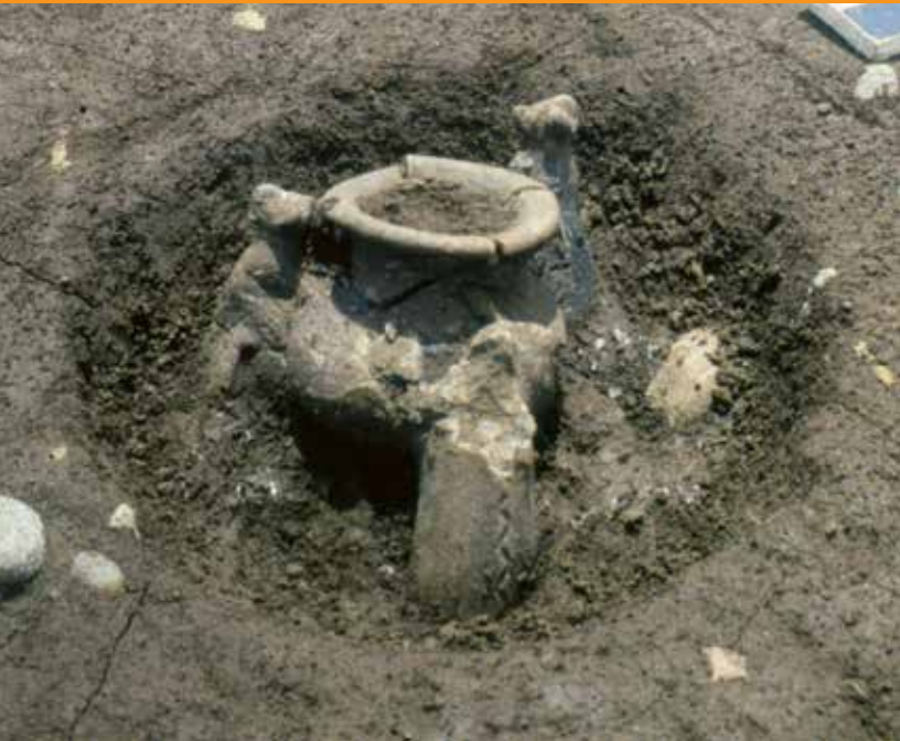
Enterramiento con ofrenda de un jarrón trípode África. Sitio arqueológico Polideportivo B. Caribe Central Colección Museo Nacional de Costa Rica.

Fase El Bosque: comprende desde el 300 a.C. al 300 d.C.; los jarrones son llamados Ticabán.