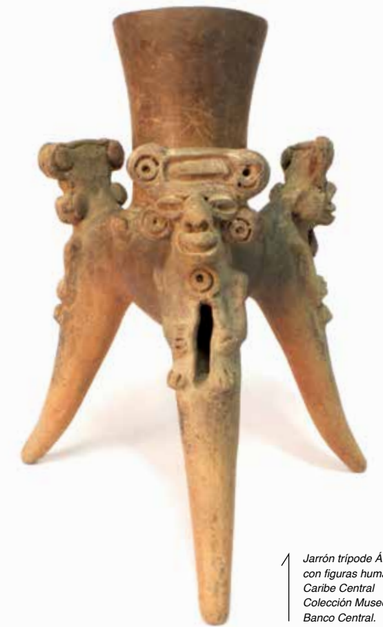
Jarrón trípode África con figuras humanas. Caribe Central Colección Museos del Banco Central.

Fase La Selva: entre los años 300 al 800 d.C.; los jarrones son llamados África.