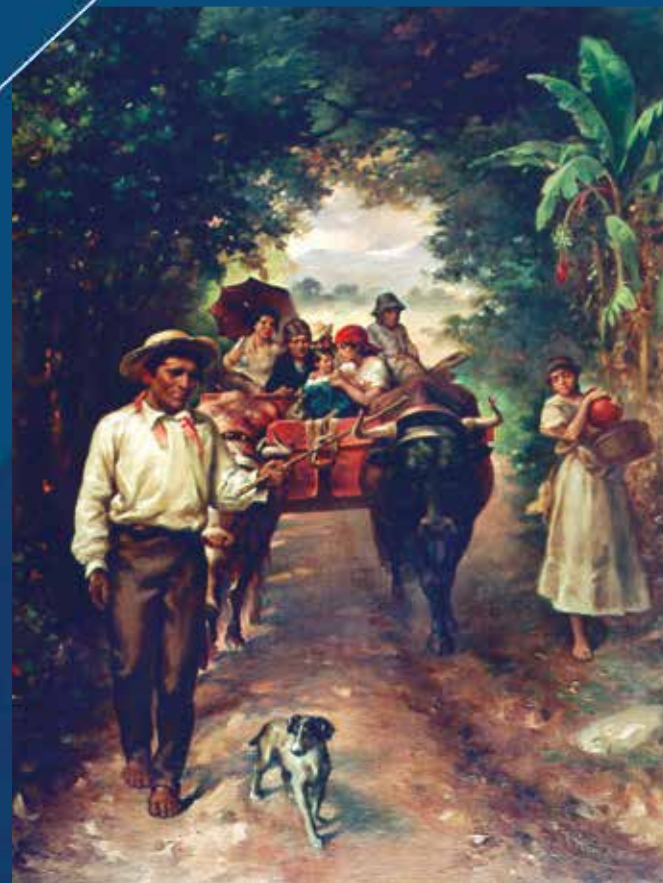
Tomás Povedano. Domingueando . Óleo sobre tela. 75.5 x 51 cm. Sin fecha (ca. 1905). Colección Museo de Arte Costarricense.

En obras como “Domingueando”, en paisajes y escenas de café, Povedano aportó una mirada particular del costarricense, de su gente, de sus pueblos y actividades, considerada, por muchos, como una visión romántica o idílica de la Costa Rica de su época.