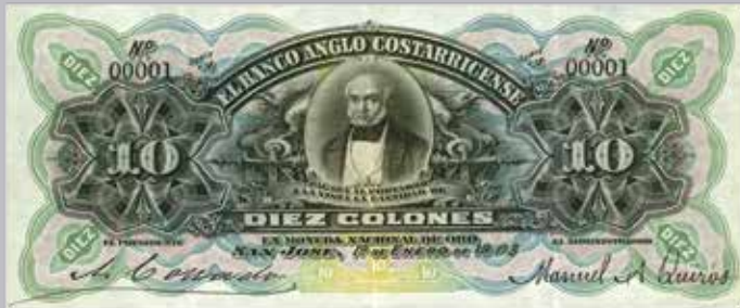
10 colones, Banco Anglo Costarricense, serie A, 1903, con grabado del retrato de Braulio Carrillo Colina, jefe de Estado (1835-1837; 1838-1842).

El primer retrato conocido, realizado por Tomás Povedano, y utilizado como base para el grabado de un billete, es el del ex jefe de Estado Braulio Carrillo (1835-1837; 1838-1842), el cual aparece en el billete de 10 colones del Banco Anglo Costarricense de 1903. Retrato que había sido publicado, en 1902, en la Revista de Costa Rica en el siglo XIX. Posteriormente, en 1917, la imagen de José Rafael Gallegos –prócer de la Independencia y ex jefe de Estado costarricense (1833-1835 y 1845-1846)– fue grabada en un billete de 1 colón del Banco Anglo Costarricense que nunca salió a circulación.