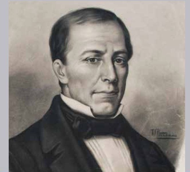
Retrato del ex-jefe de Estado Manuel Aguilar Chacón. Dibujo de Tomás Povedano. Colección Museo Nacional de Costa Rica.

El género del retrato fue, sin duda alguna, muy importante en la producción artística de fines del siglo XIX e inicios del XX, como parte de la conformación de las nuevas Repúblicas y el deseo de ensalzar a sus grandes hombres en el proceso de construcción de la Nación.