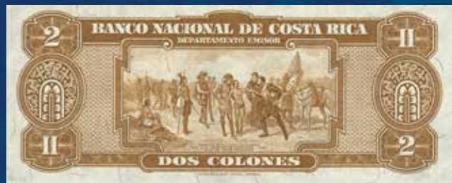
Reverso del billete de 2 colones, Banco Nacional de Costa Rica, serie E, 1941, con grabado de la obra "Rescate de Dulcehe", de Tomás Povedano.