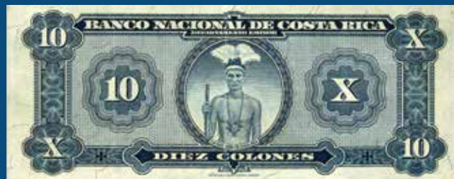
Reverso del billete de 10 colones, Banco Nacional de Costa Rica, serie F, 1939, con grabado de "cacique indio de Costa Rica".

Posiblemente, la interpretación de la historia en que se basó esta decisión provino de la Cartilla Histórica de Costa Rica, del historiador Ricardo Fernández Guardia.