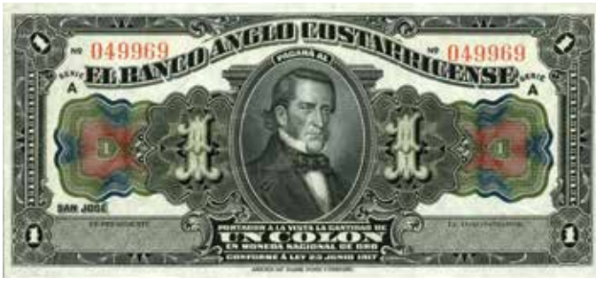
1 colón, Banco Anglo Costarricense, serie A (fórmula), 1917, con grabado del retrato de José Rafael Gallegos Alvarado, jefe de Estado (1833-1835; 1845-1846)