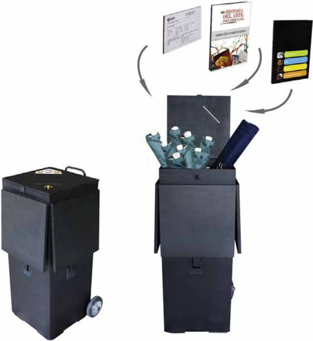
Museos del Banco Central. Exhibición itinerante: Historia del Arte costarricense