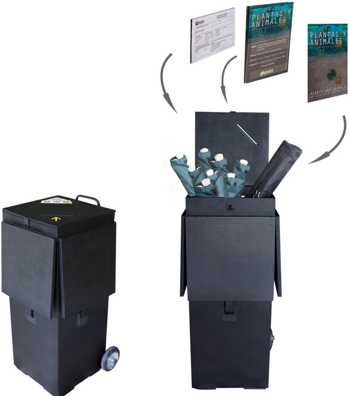
Museos del Banco Central. Exhibición itinerante: Historia de la Moneda en Costa Rica